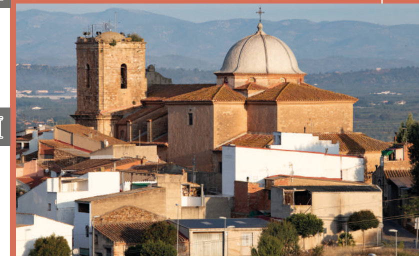
ÉGLISE DE SAN JUAN BAUTISTA