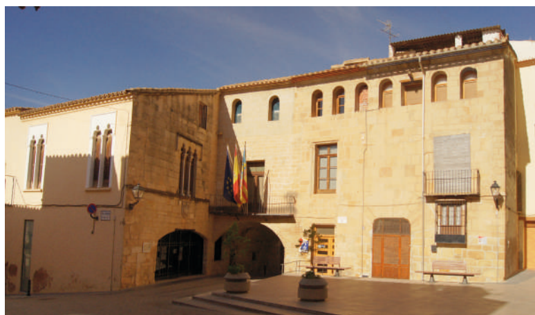
MAIRIE ET PRISON MÉDIÉVALE DE CABANES

Sous l'arcade de calle San Mateu, qui accueillait également l'ancienne bourse de commerce, on trouve la prison médiévale masculine, datant du XVe siècle. Il y avait également une prison féminine, située à l'intérieur du palais municipal, c'est-à-dire de la mairie actuelle.