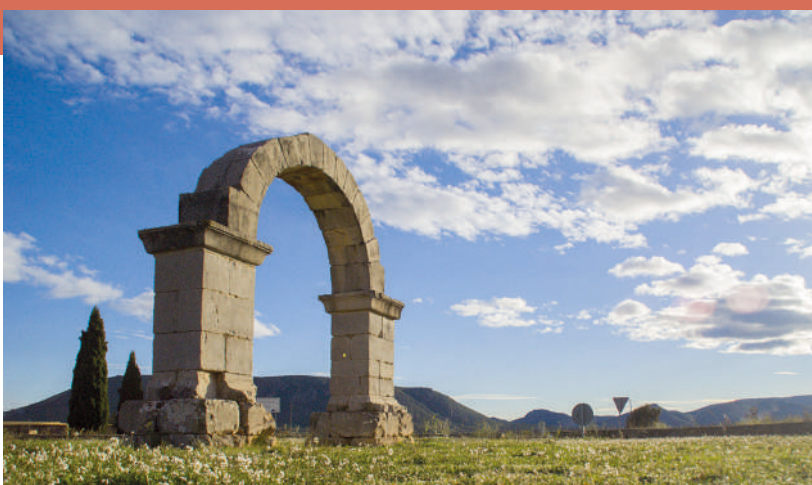
ARC ROMAIN DE CABANES