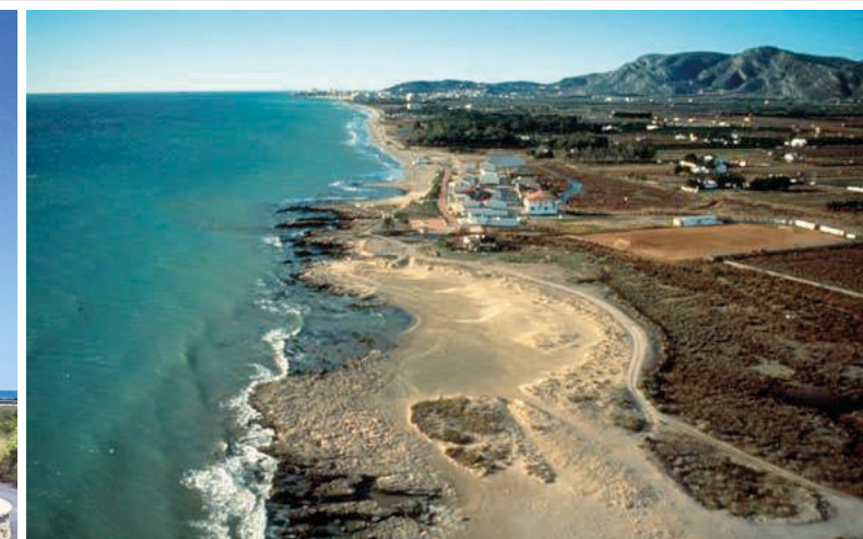
NATURPARK EL PRAT DE CABANES-TORREBLANCA