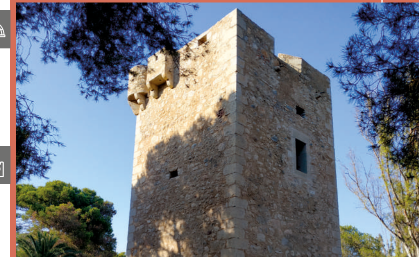
TORRE LA SAL