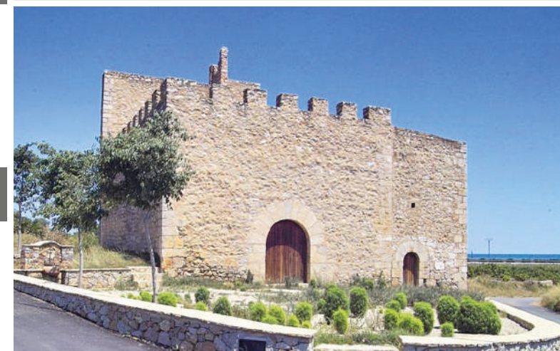
BURG UND KIRCHENFESTUNG VON ALBALAT