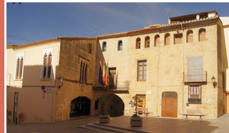
RATHAUS UND MITTELALTERLICHES GEFÄNGNIS VON CABANES

Unter der Arkade in der Straße San Mateo, wo sich auch der alte Fischmarkt befand, befindet sich das mittelalterliche Männergefängnis aus dem 15. Jahrhundert. Es gab auch ein Frauengefängnis, das sich im Stadtpalast, dem heutigen Rathaus, befand.