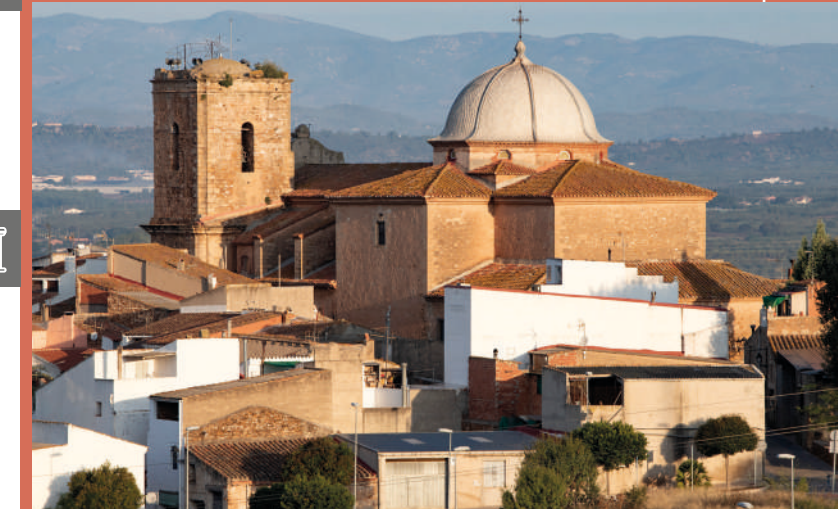
KIRCHE VON SAN JUAN BAUTISTA