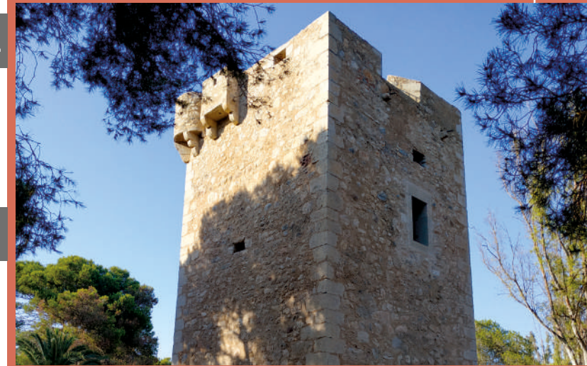
TORRE LA SAL